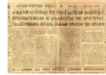
Εφημερίδα «Καθημερινά Νέα», 31 Μαρτίου 1946

Μέχρι το 1943, που ξεκινάει μουσικές σπουδές στο Ωδείο Αθηνών και γνωρίζεται με την έντεχνη Ευρωπαϊκή μουσική, έχει επηρεασθεί από τη βυζαντινή μουσική, έχει σχηματίσει χορωδία και έχει συνθέσει τραγούδια όπως και κομμάτια για βιολί και πιάνο. Παράλληλα με τον μουσικό γεννιέται και ο πολίτης-αγωνιστής Θεοδωράκης , ο οποίος, παρ' όλες τις διώξεις τις εξορίες και τις κακουχίες, ασχολείται με τη μουσική και τη σύνθεση ακόμη και κάτω από τις πιο αντίξοες συνθήκες.