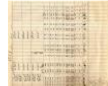
Από το έργο «Ελεγείο και θρήνος»

Το έργο του στο διάστημα από το 1943 έως το 1954, οπότε φεύγει για σπουδές στο Παρίσι, αριθμεί πάνω από 70 συνθέσεις. Ανάμεσά τους, ορχηστρικά έργα όπως η Μαργαρίτα , Το Πανηγύρι της Ασή-Γωνιάς , το Σεξτέτο , το Ορφέας και Ευρυδίκη και η Ελληνική Αποκριά (για το Ελληνικό Χορόδραμα της Ραλλούς Μάνου) και η Πρώτη Συμφωνία , για την οποία αξίζει χαρακτηριστικά να αναφέρουμε ότι γράφτηκε σε εξορία στην Ικαρία και τη Μακρόνησο , και στην Αθήνα και τα Χανιά.