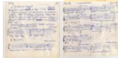
Σημειώσεις, σε χαρτοπετσέτες, από τις φυλακές Ωρωπού

παράλληλα φέρει πολλά νεωτεριστικά στοιχεία: την ταυτόχρονη παρουσία στο έργο αφ' ενός του αφηγητή-ψάλτη και του λαϊκού τραγουδιστή και αφ' ετέρου της κλασικής και της λαϊκής ορχήστρας. Σε ώρες περισυλλογής και πάλι στις φυλακές του Ωρωπού (Οκτώβριος 1969 έως Απρίλιος 1970) κάνει αναλύσεις των έργων του και σημειώνει, σε διάφορα μέσα, τη σχέση των μελωδιών του με αυτές των βυζαντινών ύμνων και των δημοτικών τραγουδιών.