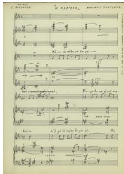
Η πρώτη σελίδα από το αθησαύριστο έργο « Η Μάγισσα» για φωνή και πιάνο