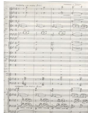
Πρώτη σελίδα από την έκδοση του έργου του Γ. Πλάτωνος «Θαλασσινή Φαντασία».