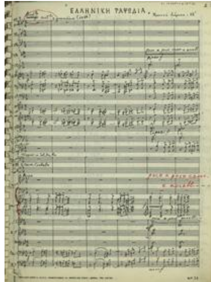
Πρώτη σελίδα του έργου Ελληνική Ραψωδία για ορχήστρα

Κατά την τακτοποίηση του αρχείου ελήφθη υπ' όψιν ο χειρόγραφος κατάλογος που είχε συντάξει ο ίδιος ο συνθέτης, καθώς επίσης και οι κατάλογοι που παρατίθενται στο Λεξικό Ελλήνων συνθετών της Α. Συμεωνίδου (σελ. 347-348), όπως ήδη αναφέραμε και στο Λεξικό της Ελληνικής Μουσικής του Τ. Καλογερόπουλου (σελ. 107-108 τ.5). Βάσει των παραπάνω μετά το πέρας της αναλυτικής καταγραφής ανεδείχθησαν κάποια αθησαύριστα έργα του Γ. Πλάτωνος τα οποία και παραθέτουμε ανά κατηγορία: