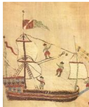
Μελίκης, Γ., Δημοτικά τραγούδια για τη Θεσσαλονίκη, Θεσσαλονίκη: Ηχολόγος, 1987., σ.13.