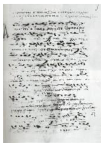
Baud-Bovy, S. Δοκίμιο για το ελληνικό δημοτικό τραγούδι, Ναύπλιο: Πελοποννησιακό Λαογραφικό Ίδρυμα, 1994., πιν. III