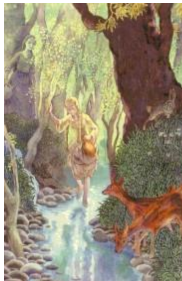
Ρηγάτος, Γερ. Α., Η Ιατρική στο Δημοτικό τραγούδι, Αθήνα: Διαχρονικές Εκδόσεις, 2003., σ.219.