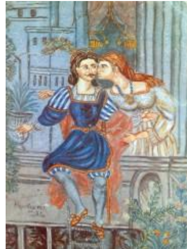
Μελίκης, Γ., Δημοτικά τραγούδια για τη Θεσσαλονίκη, Θεσσαλονίκη: Ηχολόγος, 1987., σ.30.

Όλα τα βιβλία που παρουσιάζονται παρακάτω μπορείτε να τα βρείτε στη συλλογή της Βιβλιοθήκης.