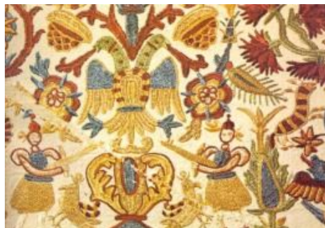
Ανωγειανάκης, Φ. Ελληνικά Λαϊκά Μουσικά Όργανα, Αθήνα: Εκδοτικός Οίκος Μέλισσα, 1991, σ.227

▣ Λαμφίδης, Π., Δημοτικά τραγούδια του Πόντου. Α΄ Τα κείμενα: ανθολόγηση-νεοελληνική απόδοση, (Αθήνα: Μυρτίδης, 1960).