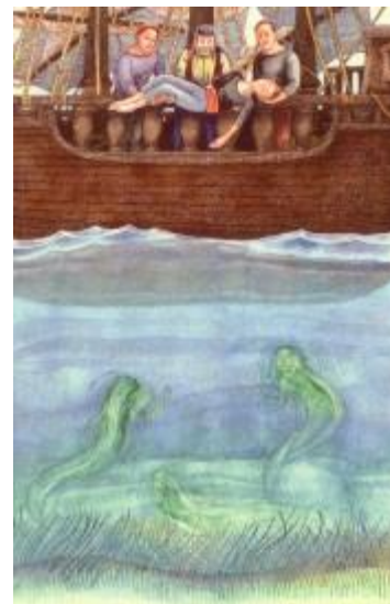
Ρηγάτος, Γερ. Α., Η Ιατρική στο Δημοτικό τραγούδι, Αθήνα: Διαχρονικές Εκδόσεις, 2003., σ.121.