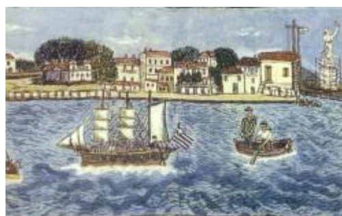
Αρχείο Ελληνικής Μουσικής : Μυτιληνιά και Σμυρνεία με το Νίκο Καλαϊντζή-Μπινταγιάλα, Αθήνα: ΑΕΜ009, χ.χ. (εικόνα από εξώφυλλο)

▣ Δημόπουλος, Ι. Αθ., επιμ., Το δημοτικό τραγούδι, (Μουσούνιτσα Φωκίδος: Ιωάννης Αθ. Δημόπουλος, 19—)