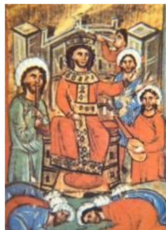
Μελίκης, Γ., Δημοτικά τραγούδια για τη Θεσσαλονίκη, Θεσσαλονίκη: Ηχολόγος, 1987., σ.19.

▣ Χασιώτου, Γ. Χρ., Συλλογή των κατά την Ήπειρον Δημοτικών Ασματών, (Αθήνα: Βιβλιοπωλείον Α.Ν.Καραβία, [1983]).