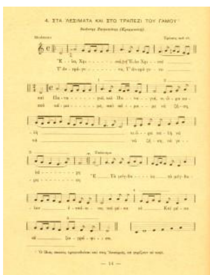
Baud-Bovy, S. Τραγούδια των Δωδεκανήσων, Αθήνα: Βιβλιοπωλείο Ι.Ν.Σιδέρη, 1935, σ.14 (Τραγούδι του Γάμου από τη Ρόδο)