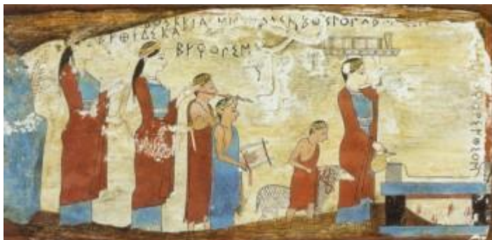
Πίνακας με σκηνή θυσίας (αντίγραφο του Gillieron) από τον Κατάλογο της Έκθεσης Μουσών Δώρα, που έγινε στο Μέγαρο Μουσικής Αθηνών (01/07-15/09/2004), σελ 217.

Οι γνώσεις μας για τον ρόλο και τη θέση της μουσικής στην αρχαία Ελλάδα εμπλουτίστηκαν με εντατικούς ρυθμούς τα τελευταία χρόνια, χάρη στη συστηματική έρευνα διακεκριμένων επιστημόνων ανά τον κόσμο. Οι περισσότερες από αυτές προέρχονται κυρίως από φιλολογικές πηγές όπου συγκεντρώνονται άμεσες και έμμεσες αναφορές και από τις απεικονίσεις των μουσικών οργάνων στα έργα της