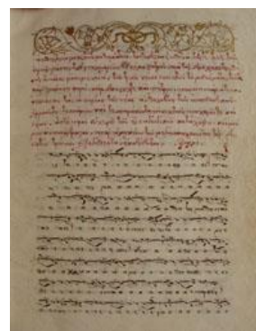
Χειρόγραφο 1, φύλλο 1α

Αναμφισβήτητα, το πιο σπουδαίο χειρόγραφο της συλλογής είναι ο αριθμός 1, μια Ανθολογία με πολλές εξηγήσεις μελών στην προ της Νέας Μεθόδου μουσική γραφή. Η επιγραφή του φ. 1α είναι χαρακτηριστική: «Ανθολογία μουσικών μαθημάτων, τα ένδεκα εωθινά, τας τε τρεις των ωρών στάσεις του στιχηραρίου του [Γερμανού, Επισκόπου] Νέων Πατρών, και τας δυσλήπτους θέσεις απάσας εμπεριέχουσα. Των τριών νέων ποιητών τα μαθήματα, του τε κυρ Ιωάννου φημί, κυρ Δανιήλ τε και Πέτρου. Πασαπνοάρια τινά. Απάσας τας απορίας της νέας ανθολογίας των παπαδικών, ειρμών τε τεσσάρων και τεσσαράκοντα, ποιητών παλαιών τε και νέων. Α δη προς ευχερή των εισαγωγικών κατάληψιν και μνήμην αναπόδραστον, παρ' Ακακίου του Μεγασπηλαιώτου τον δυνατόν τρόπον εξηγηθέντα, εκδέδοται».