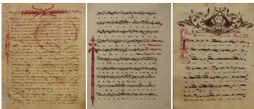
Χειρόγραφο 8, φύλλο 1α

Το γεγονός δεν είναι σπάνιο ιδιαίτερα από τον ΙΣΤ' αιώνα και εξής, έχει όμως την αναμφισβήτητη σπουδαιότητά του, καθώς αυτές οι συλλογές δεν ακολουθούσαν πάντα μια σχηματοποιημένη μορφή και δομή της ύλης, με συνέπεια να ενσωματώνονται ενίοτε στα χειρόγραφα και στοιχεία που παρουσιάζουν πρωτοτυπία, ή και μοναδικότητα. Ένα τέτοιο φαίνεται πως υπάρχει και στο φύλλο 79β του κώδικα, όπου ο γνωστός τροχός των ήχων παρουσιάζεται ως «ο κύκλος του Ιακώβου πρωτοψάλτου». Ο περίφημος και λόγιος αυτός πρωτοψάλτης που απεβίωσε το 1800 δεν μαρτυρείται από αλλού ως συντάκτης τέτοιων σχεδιαγραμμάτων, τα οποία ωστόσο θεωρείται δεδομένο ότι χρησιμοποιούσε στη διδασκαλία του.