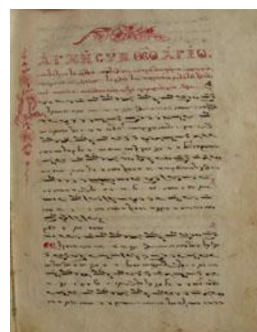
Χειρόγραφο 2, φύλλο 1α

Ο κώδικας υπ' αριθμόν 2 της συλλογής δεν διακρίνεται για το πρωτότυπο περιεχόμενό του, παρά για τον γνωστότατο γραφέα του, ο οποίος αποτελεί μια ξεχωριστή περίπτωση στην ιστορία της ψαλτικής τέχνης. Πρόκειται για τον Απόστολο Κώνστα τον Χίο ο οποίος συνέγραψε την Ανθολογία του Όρθρου της Νέας Παπαδικής για την οποία ομιλούμε, περίπου στα χρόνια 1815-1819, χρησιμοποιώντας τη Νέα Μέθοδο. Πρόκειται για ένα ακόμη αυτόγραφο του σπουδαίου αυτού μουσικού, του οποίου ο κάλαμος παρήγαγε τουλάχιστον 120 κώδικες, όπως μία πρόσφατη διδακτορική διατριβή, αλλά και ημέτερες έρευνες κατέδειξαν.