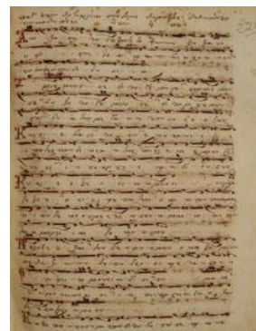
Χειρόγραφο 11, φύλλο 220α