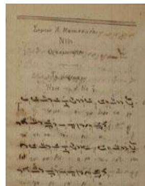
Χειρόγραφο 15, φύλλο 1